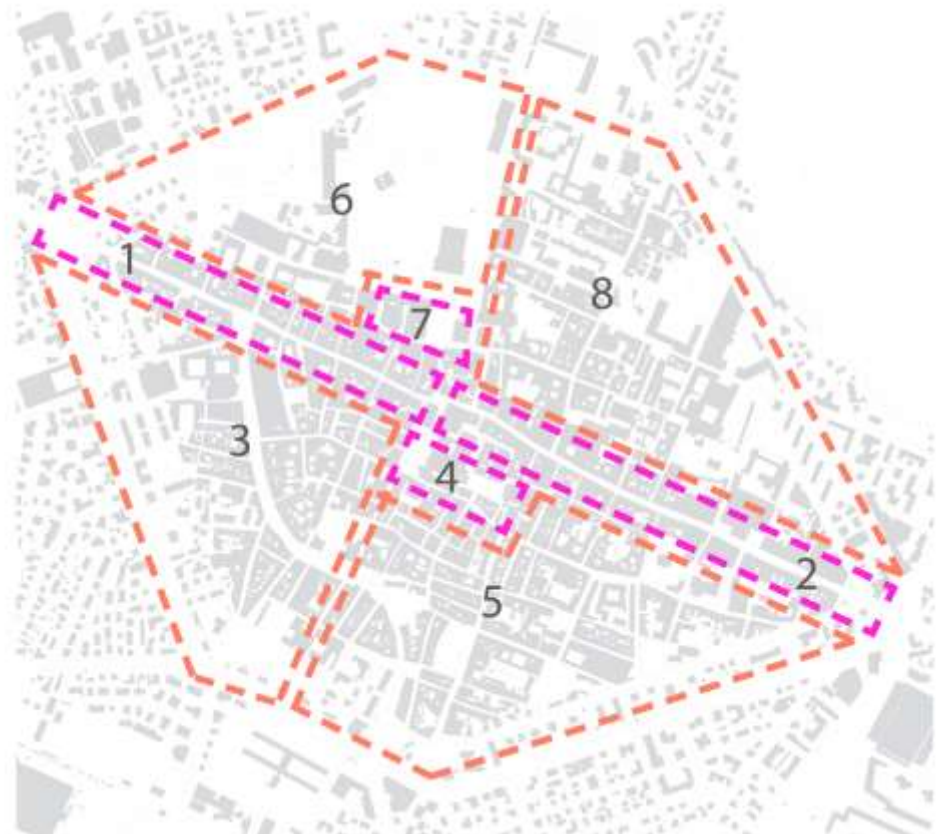
rilevazione negozi_quadro numerico